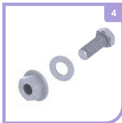
CONJ. TORNILLERÍA CTAG 615