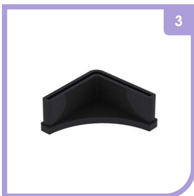
CALZO DE PLÁSTICO